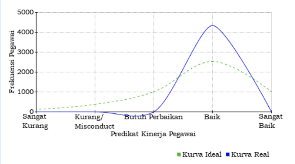
KURVA DISTRIBUSI PREDIKAT KINERJA PEGAWAI DENGAN CAPAIAN KINERJA ORGANISASI BAIK